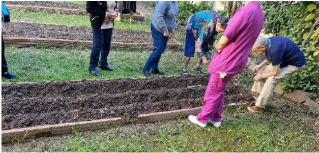
Plantant els calçots

Paral·lelament, hem continuat amb les activitats amb la residència d'avis de la Sagrera i amb el col·legi Pont del Dragó, (Institut de Disseny i Arts Gràfiques); amb els primers, a part de diferents visites o estades, ells tenen clau per poder anar quan vulguin, fem dues activitats, una per preparar les cebes i plantar els calçots, i un cop que arriba el febrer, recollir-los.