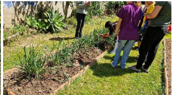
Recollint els calçots

Pel que fa als nens del Pont del Dragó, fem tot el cicle de produir aliment, i com el que es pot veure és la producció de calçots, fem tot el procés, des de preparar el terreny, a plantar-los, recalçar-los i, finalment, recollir-los. A part, com assisteixen un dia per setmana, si els és possible, també desenvolupen diferents activitats de sembra o plantació d'hortalisses. Cal recordar que com l'hort és formatiu o explicatiu, els diferents productes es deixen espigar i que treguin les seves llavors, per tal de poder explicar l'objectiu de les plantes. Con ve sent habitual, si d'alguna de les hortalisses hi ha un excedent de les activitats, les recollim i les portem al banc d'aliments per tal que puguin ser aprofitades.