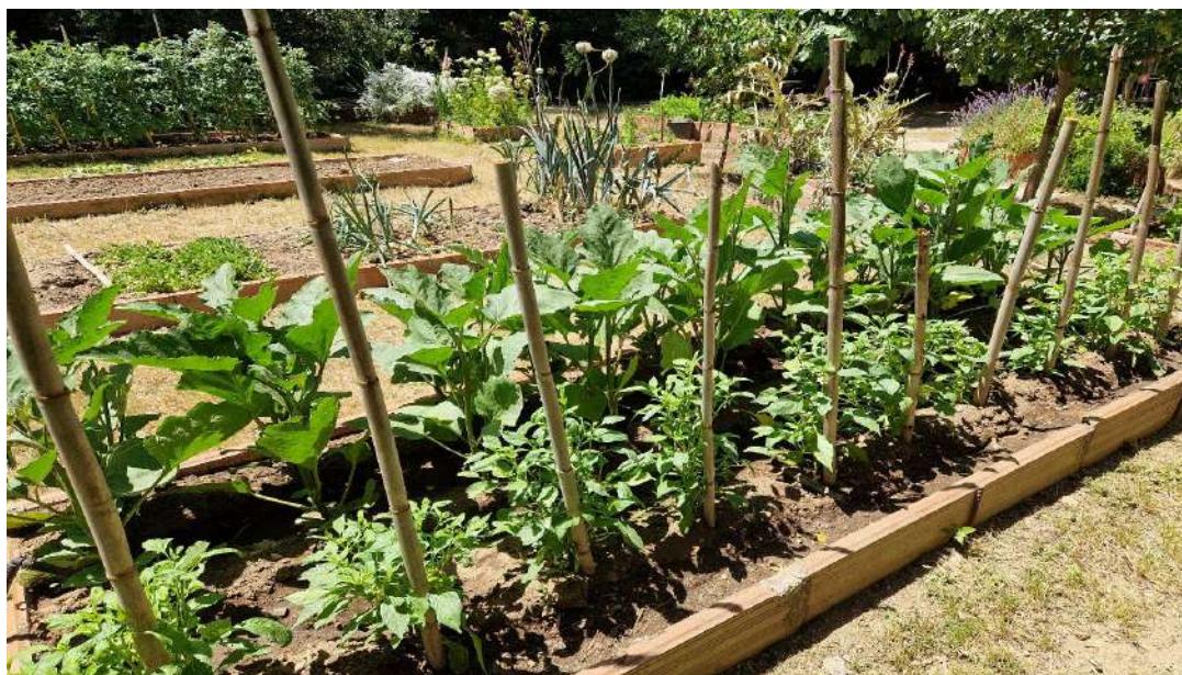
Albergínies i pebrots del padró

Un nou curs escolar conclou i, encara que l'hort està en el millor moment per visitar, donem per concloses i finalitzades les activitats dedicades als col·legis fins a l'inici del nou curs al setembre, o que algú d'ells vulgui fer alguna activitat d'estiu.