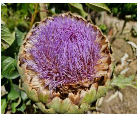
L'escarxofa, madurant les llavors