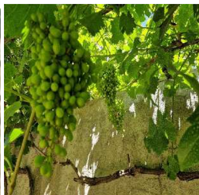
El raïm creixent

Pel que fa a les activitats, als més petits els hem exposat les diferents plantes i arbres que tenim a l'hort, i els expliquem com olorar les plantes aromàtiques, tals com la menta, l'espígol, la farigola o el llorer. Amb els mes grans, procurem tenir activitats preparades per sembrar o plantar: sembrem alls, pastanagues, raves, mongetes o patates, i aquells que fan aquesta activitat els fa il·lusió el fet de tallar-les i després posar-les als solcs i tapar-les. Pel que fa a plantar, activitat que es duu a terme entre febrer i maig, plantem les diferents hortalisses, pebroteres de diferents tipus, tomaqueres,